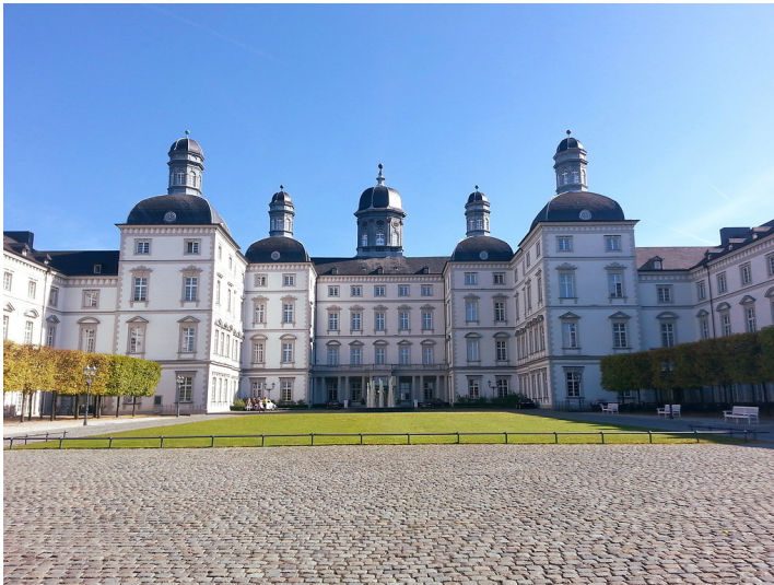
Schloss Bensberg (2013)