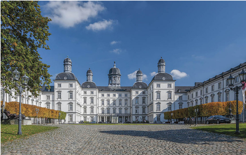
Schloss Bensberg in Bergisch Gladbach (2018)