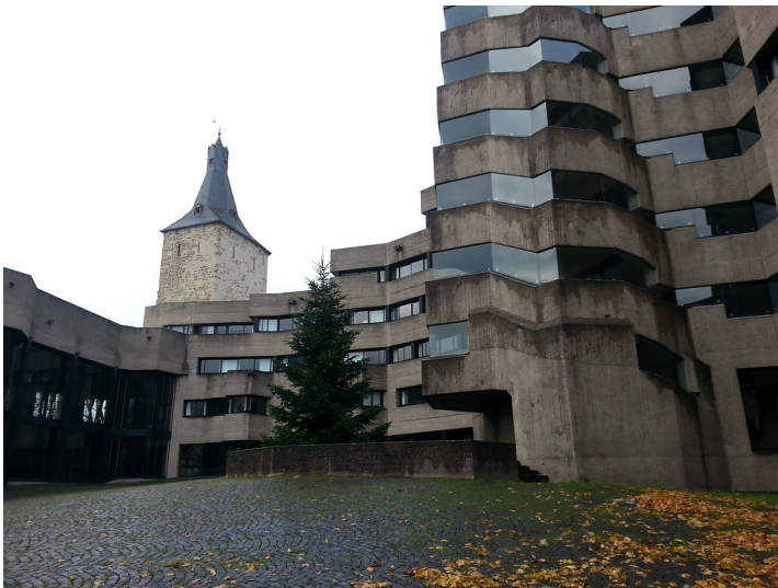
Städtisches Rathaus von Bensberg mit dem darin eingegliederten Burgturm der ehemaligen Burg Bensberg (2013)