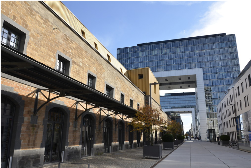
Ehemalige Zollhalle 12 im Kölner Rheinauhafen von seiner Westseite (2014)