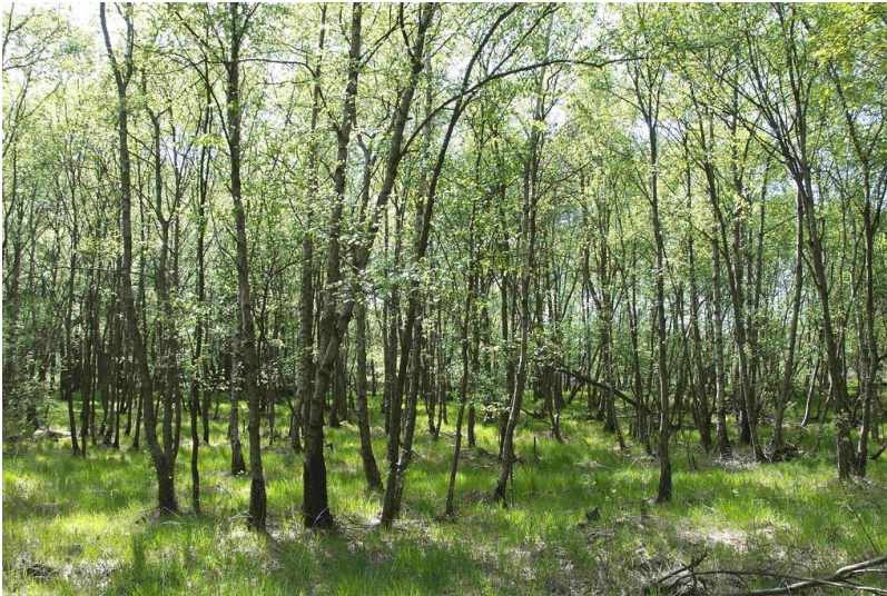
Birken-Niederwald im Nutscheid (2012)