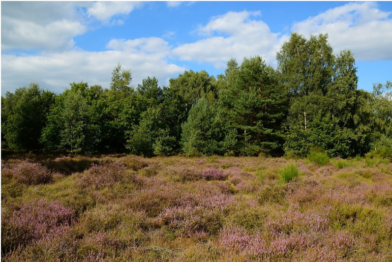
Heidelandschaft der Kaninchenberge