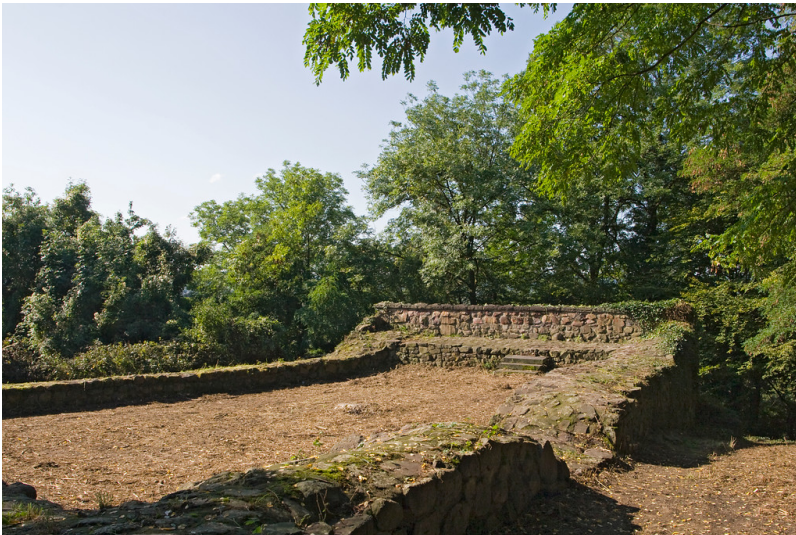
rekonstruierter Wohnturm