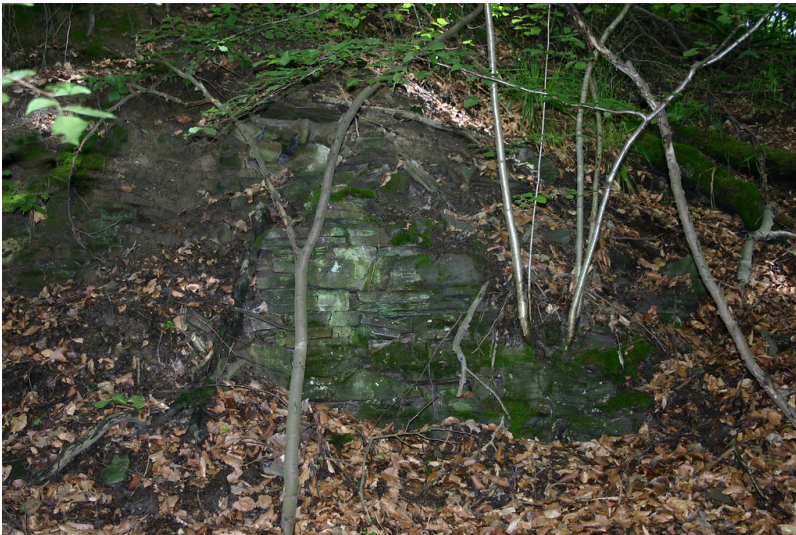
Gebäuderest der Erzwäsche im Bergwerk Glückliche Elise im Einsiedlertal in Bad Honnef (2013)