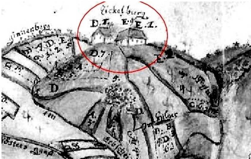
Karte mit den Besitzungen der Kölner Jesuiten 1739 mit Zickelburger Höfen bei Menzenberg in Bad Honnef