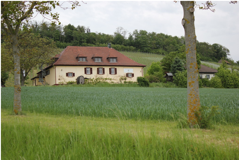
Das Elfinger Berghaus bei Maulbronn inmitten der Weinberge (2012)