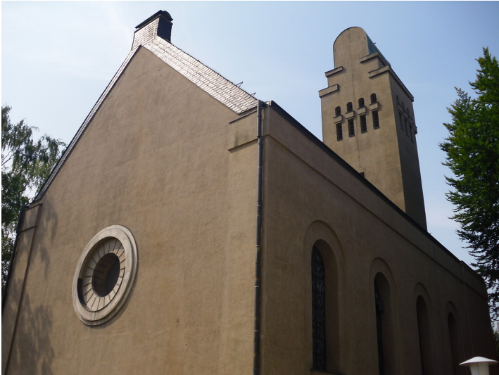
Das Gebäude der Lukaskirche in Köln-Porz mit dem vorgesetztem Turm (2013).