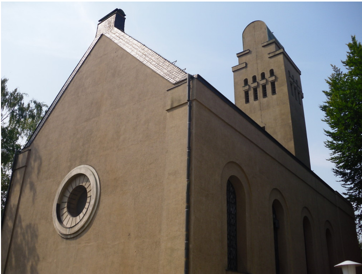
Das Gebäude der Lukaskirche in Köln-Porz mit dem vorgesetztem Turm (2013).