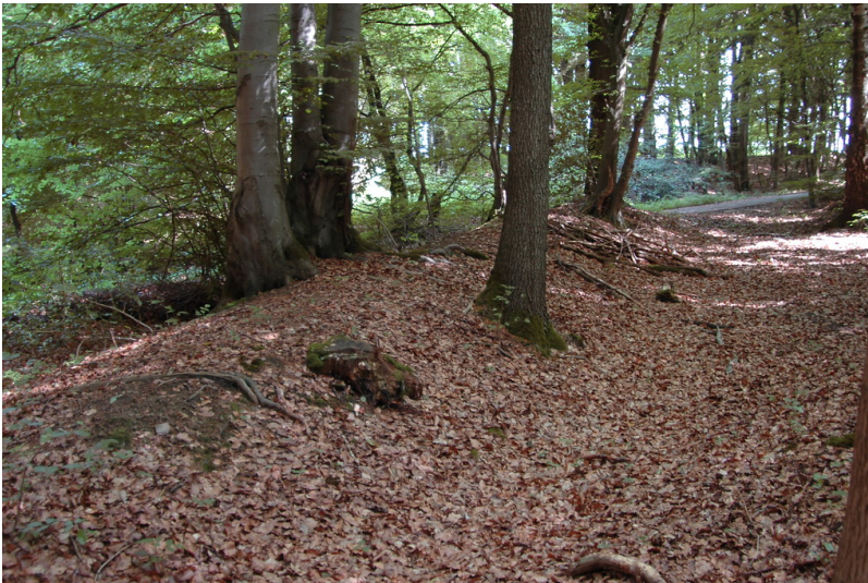
Westlicher Teilabschnitt der Landwehr Lindscheid in Eitorf (2013)