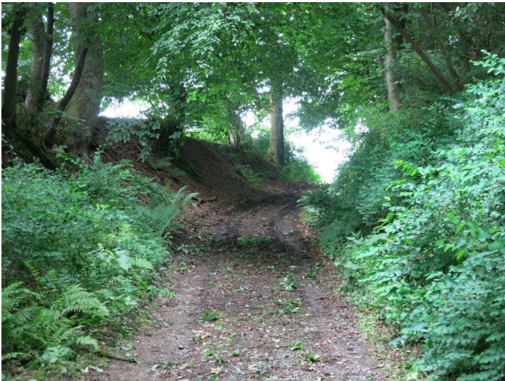
Der Hohlweg Heskesberg: Die besonders schweren Eisenkarren sorgten für eine sehr starke Eintiefung (2013).