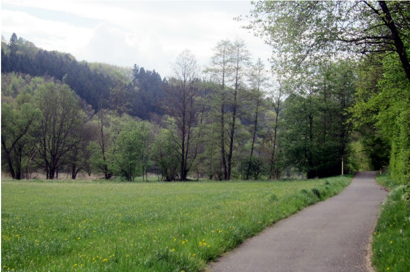
Der Wüstungsbereich der mittelalterlichen Herchener Mühle in Windeck westlich der Sieg (2014)