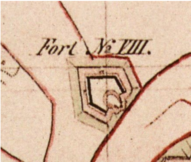
Fort VIII des heutigen Inneren Kölner Grüngürtels auf einer historischen Karte (Preußische Uraufnahme von 1845)