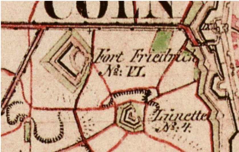
Fort VI im heutigen Inneren Kölner Grüngürtel auf einer historischen Karte (Preußische Uraufnahme von 1845)