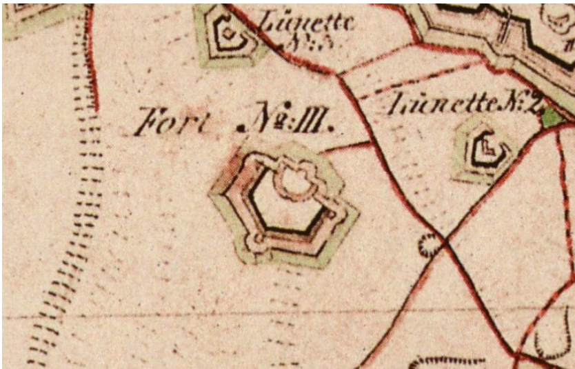
Fort III des Inneren Kölner Grüngürtels auf einer historischen Karte (Preußische Uraufnahme von 1845)