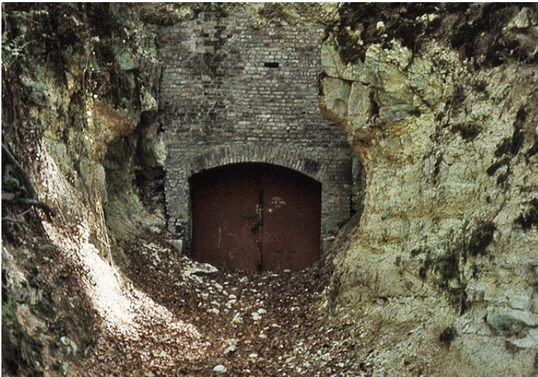
Vermauerter Zugang