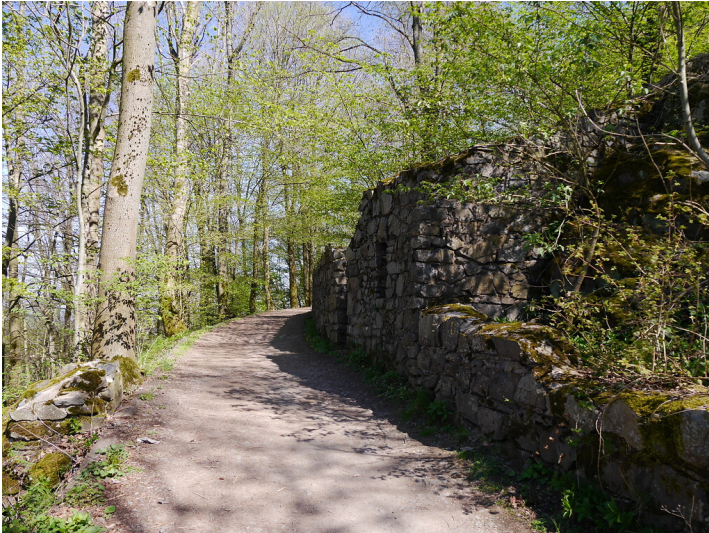
Burgruine Löwenburg im Siebengebirge (2019)