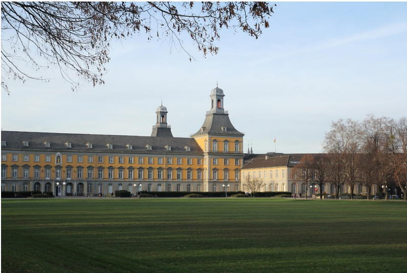
Hofgarten- und Küchenflügel des kurfürstlichen Schlosses in Bonn vom Hofgarten aus gesehen (2013)