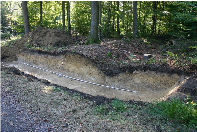
Profilschnitt durch die Landwehr Vilger Schlag bei Rodder in Eitorf (2012)