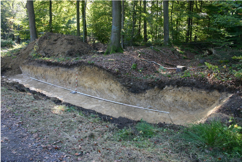
Profilschnitt durch die Landwehr Vilger Schlag bei Rodder in Eitorf (2012)