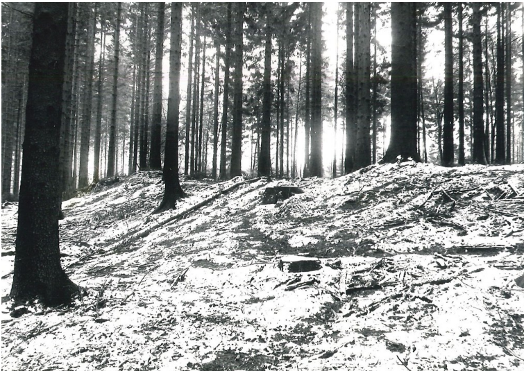
Alte Landwehr Windeck bei Alsen-Oberalsen in Windeck (1978)