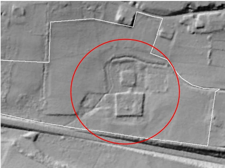
Zweiteilige Wasserburg Haus Broich bei Windeck im digitalen Geländemodell (Laserscan, Geobasis NRW, 2013)