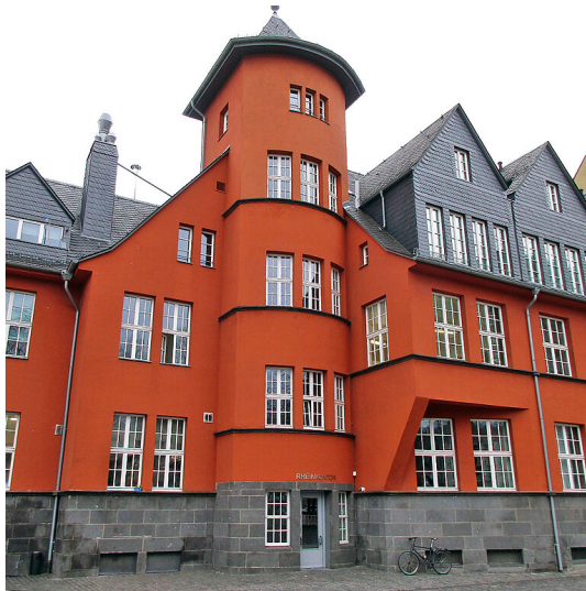
Das Rheinkontor im Rheinauhafen von der vom Rhein abgewandten Seite in Köln-Altstadt-Süd (2021).