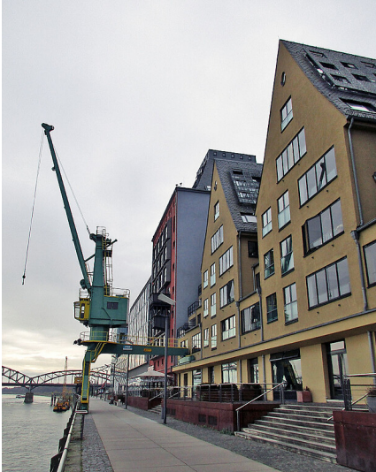
Das Danziger Lagerhaus "Siebengebirge" sowie das "Silo 23" mit der roten Fassade und der historische Hafenkran Nr. 31a im Rheinauhafen in Köln-Altstadt-Süd (2021).