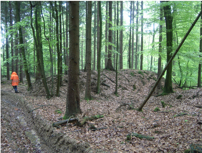
Zustand 2012