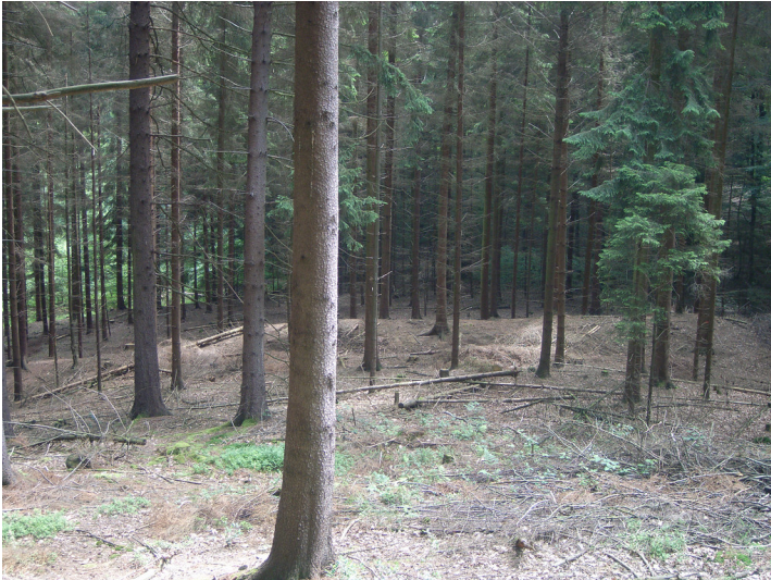
Zustand 2012