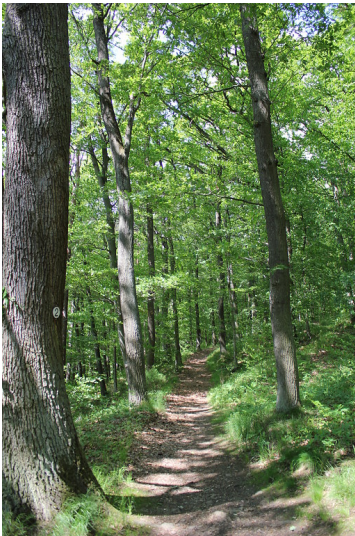
Pfad im Wald bei Maulbronn (2012)