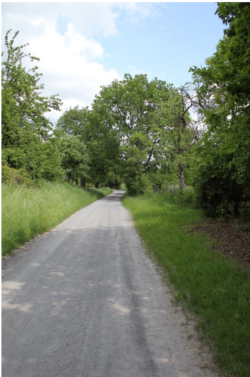
Wirtschaftsweg nördlich vom Tiefen See in Maulbronn (2012)