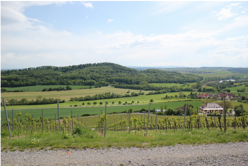
Ausschnitt des westlichen Teils der Klosterlandschaft Maulbronn (2012)