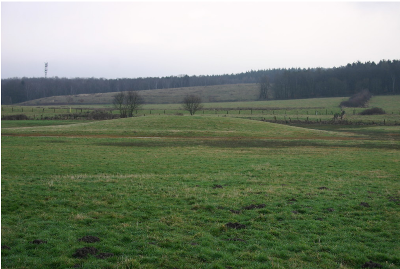
Zustand 2012 (Hügel mit dunklem, staunassem Graben von Westen)