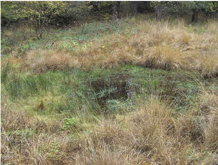
Eine mit Wasser gefüllte Pinge der Grube Silberkaule in Bennerscheid in Königswinter (2012).