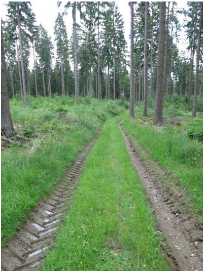
Forster Erzweg (2013)