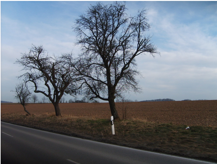
Ackerfläche in der Klosterlandschaft Maulbronn (2012). Im Vordergrund stehen am Straßenrand drei Obstbäume.