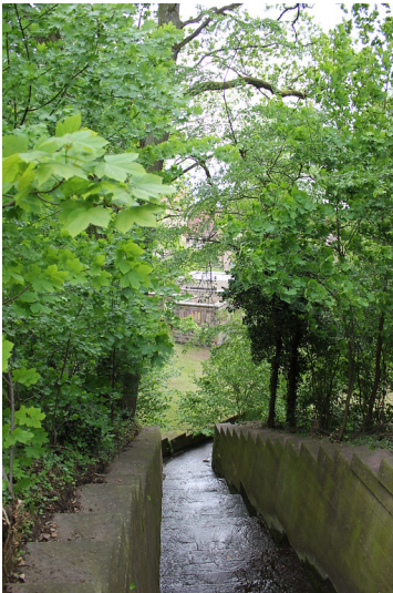
Der ummauerte Graben innerhalb der Klostermauer für die Wasserversorgung (Wasserkraft) des ehemaligen Klosters Maulbronn (2012)