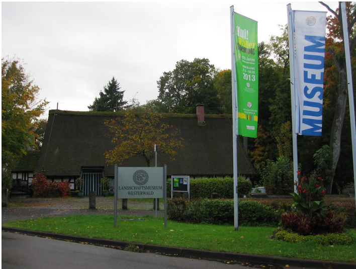
Eingangsbereich des Landschaftsmuseums Westerwald in Hachenburg von der Leipziger Straße aus gesehen mit dem Haus Norken (2013)