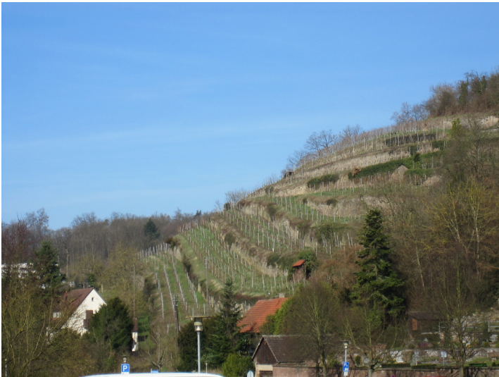
Weinbergsterrassen beim Kloster Maulbronn (2011)