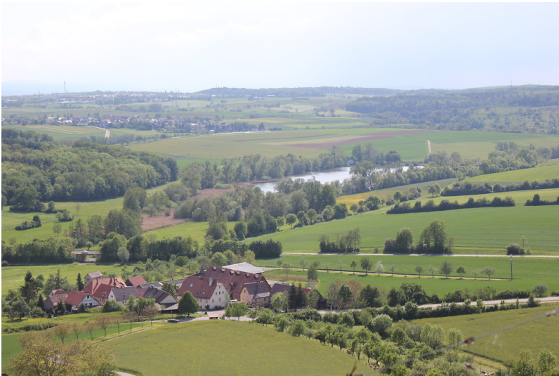
Ausschnitt des westlichen Teils der Klosterlandschaft Maulbronn (2012)