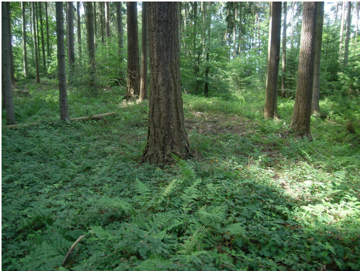
Zustand 2012