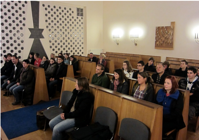
Der Innenraum der Synagoge in Koblenz-Rauental während einer Informationsveranstaltung (2011).