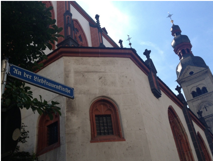
Die Katholische Liebfrauenkirche in der Koblenzer Altstadt (2013)