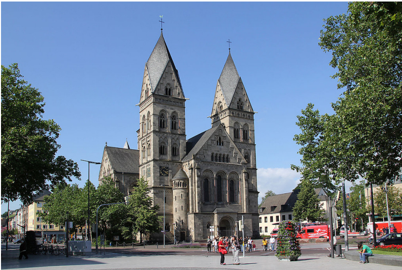
Herz-Jesu-Kirche in Koblenz, Ansicht von Nordosten (2011)