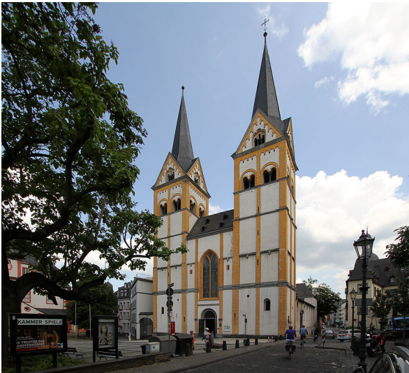
Die Florinskirche in Koblenz, Ansicht von Westen (2013).