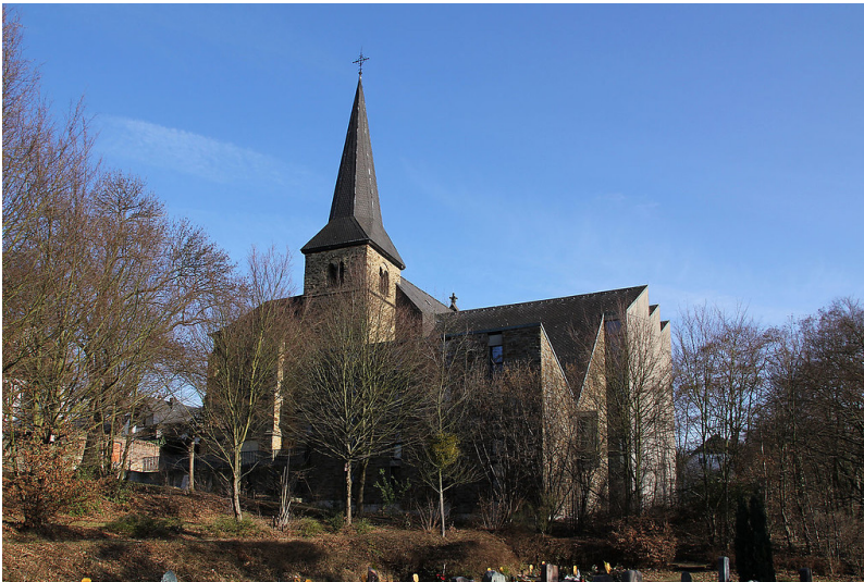
Die Katholische Pfarrkirche St. Aldegundis in Koblenz-Arzheim, Ansicht von Südosten (2012)