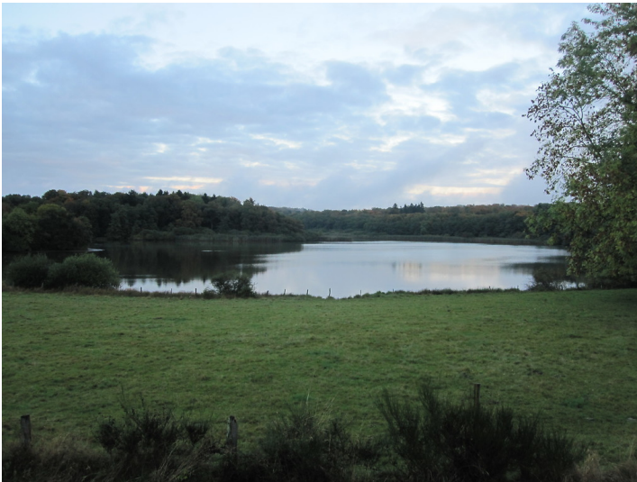
Birkenweiher in der Westerwälder Seenplatte (2013)