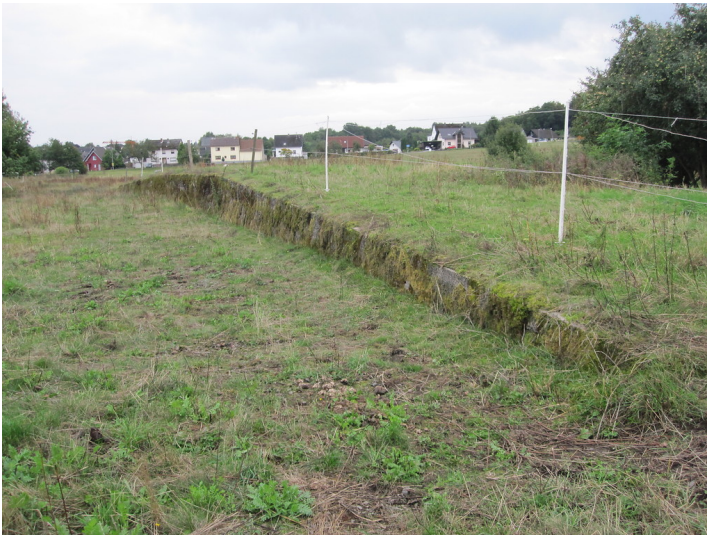
Mauerreste am ehemaligen Standort des Bahnhofs von Elbingen im Westerwald (2013)