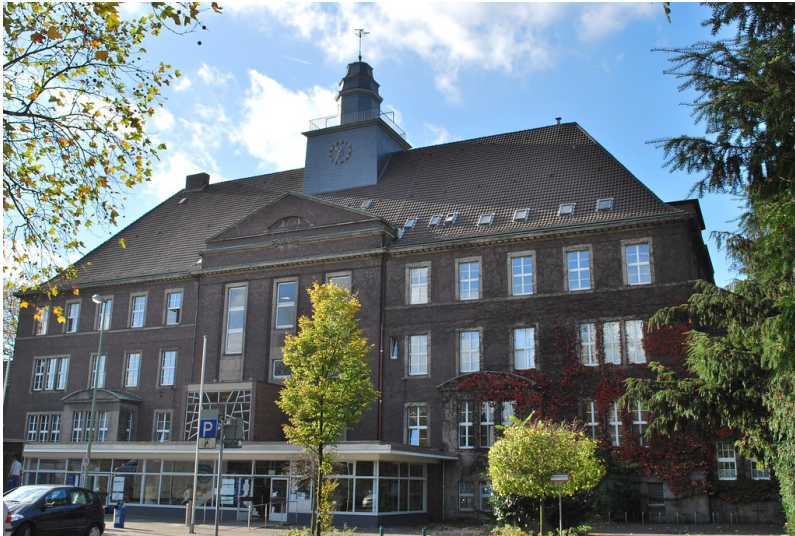
Bezirksrathaus Rheinhausen in Duisburg (2013). Der Haupteingang des Bezirksrathauses Rheinhausen ist die Rückseite der ehemaligen Schule.