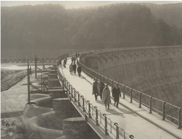
Besichtigung der Urfttalsperre durch Kaiser Wilhelm II (1906)