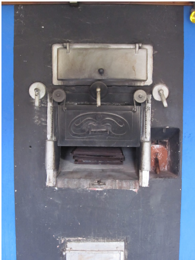
Backofen im Backhaus von Mähren im Westerwald (2013)